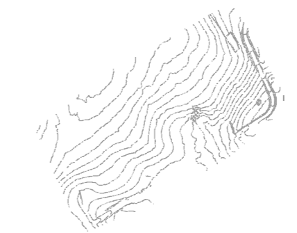
Altimetria 2 x 2 m