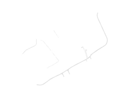
Rede viária e outras construções lineares